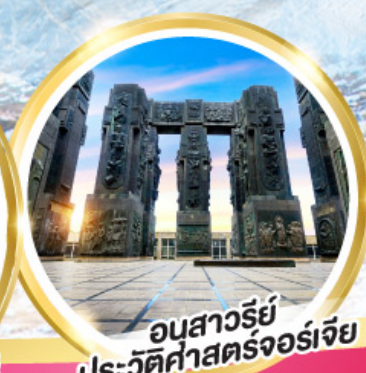
อนุสาวรีย์ ประวัติศาสตร์จอร์เจีย