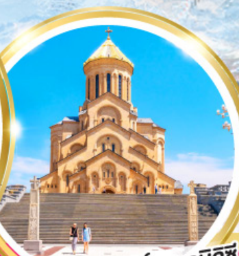
วิหารศักดิ์สิทธิ์ของทบิลีซี