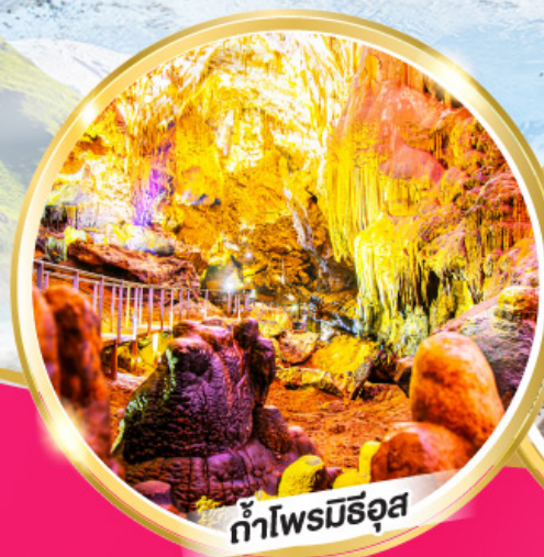
ถ้ำไฟมณีรุส