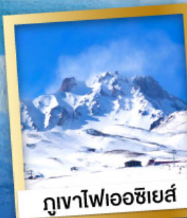
ภูเขาไฟเอซียส์