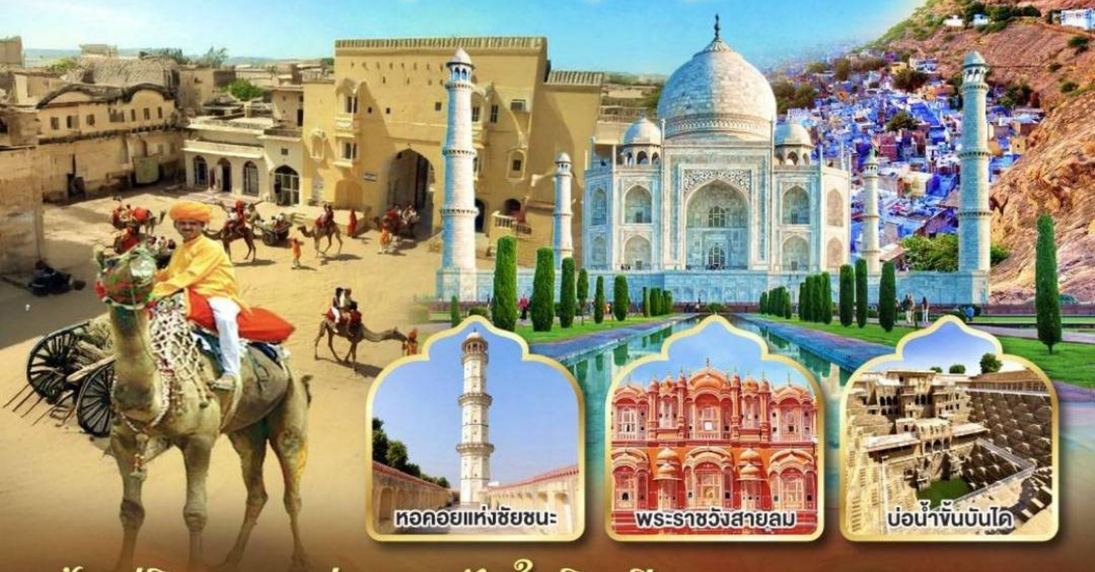
ทอคอยแห่งชัยชนะ

เดลี อัครา ชัยปุระ จอดห์ปุร์ จีจูลู มันทวา