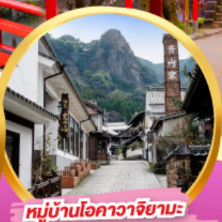
หมู่บ้านโอคาวาจิยามะ