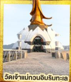
วัดเจ้าแม่กวนอิมริมทะเล