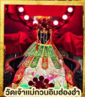
วัดเจ้าแม่กวนอิมฮ่องฮำ