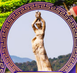
จูไห่พิงเซอร์เกิร์ล