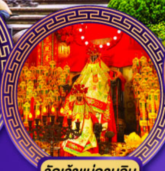
วัดเจ้าแม่กวนอิม ฮองฮ่า