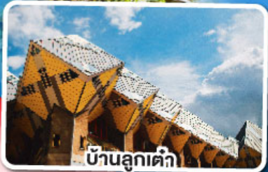
บ้านลูกเต๋า