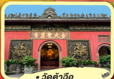
• วัดต้าอิว