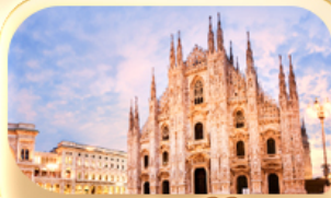
มหาวิหารดูโอโม