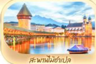
สะพานไมซ์าเปค