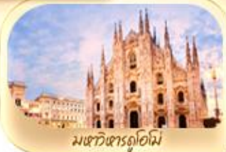
มหาวิหารดูโอโม