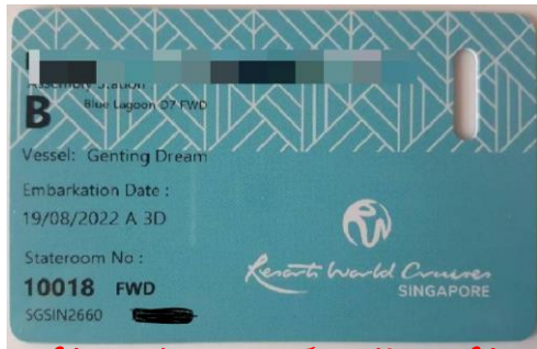
ตัวอย่างการ์ดห้องพัก