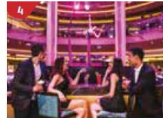
4 Bar 360 Catch live music and aerial acrobatic performances with a glass of champagne.