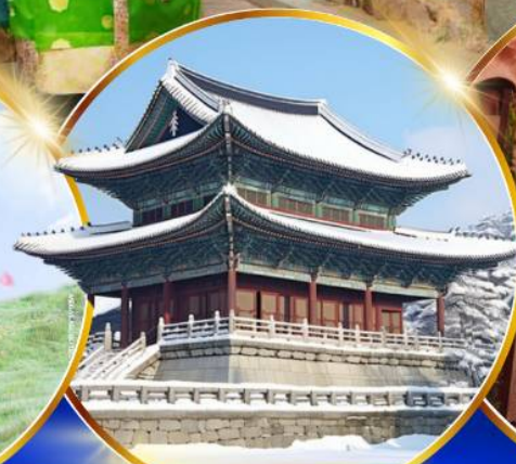
พระราชวังเคียงบกคยอง