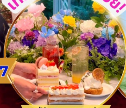
คาเฟ่ดัง Forest Outing