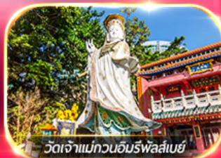
วัดเจ้าแม่กวนอิมรพหลัสเบย์