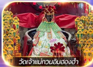
วัดเจ้าแม่กวนอิมฮ่องกง