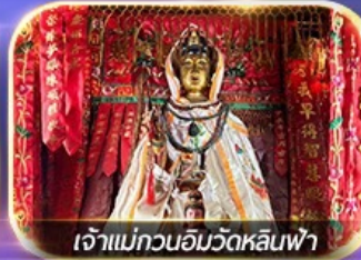
เจ้าแม่กวนอิมวัดหลินฟ้า