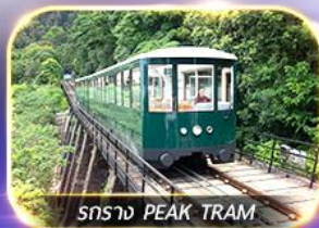
รถราง PEAK TRAM