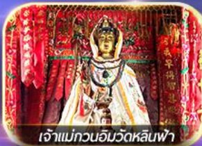
เจ้าแม่กวนอิมวัดหลินฟ้า