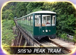
รถราง PEAK TRAM