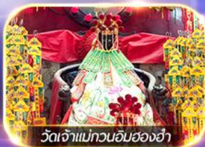
วัดเจ้าแม่กวนอิมอ่องฮ่า