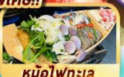
หม้อไฟทะเล