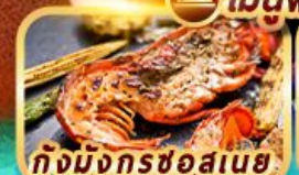
กุ้งมังกรชอสนาย