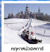
ฤดูหวนวอลการ