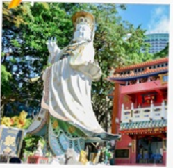
เจ้าแม่กวนอิมรพัสลเบย์