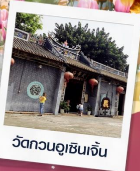
วัดกวนอูเซินเจิ้น