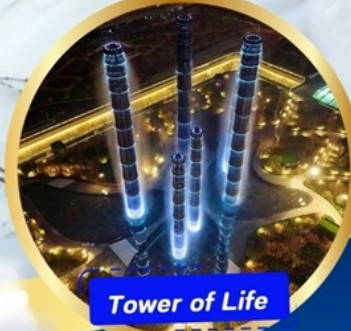
Tower of Life

อุทยานภูเขาสี่ฤดู หุบเขาของเฉียวโกว (รวมรถอุทยาน) อุทยานหนีเฟิงโกว (รวมรถอุทยาน + รถแบตเตอรี่) ภูเขาหิมะการ์เซียต้ากู่ปิงชว่น (รวมรถอุทยาน+กระเช้า) - วัดต้าฉือ ถนนคนเดินชุนซีลู่ - ชมแสงสี The Tower of Life ที่ลานห้าง SKP ถนนคนเดินซอยกว้างแคม - POP MART