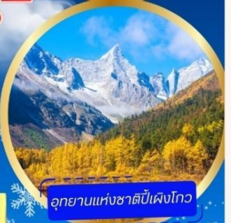
อุทยานแห่งชาติปี้เผิงโกว

อุทยานภูเขาสี่ดรุณี หุบเขาของเสี่ยวโกว (รวมรถอุทยาน) อุทยานปี้เผิงโกว (รวมรถอุทยาน + รถแบตเตอรี่) ภูเขาหิมะการ์เซียต้ากู่ปิงชว่น (รวมรถอุทยาน + กระเช้า) - วัดต้าฉือ ดินแดนเดินชุนซีลู่ - ชมแสงสี The Tower of Life ที่ลานห้าง SKP ถนนคนเดินชอยกวางแจม - POP MART