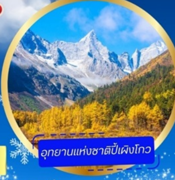
อุทยานแห่งชาติหนีเฟิงโกว