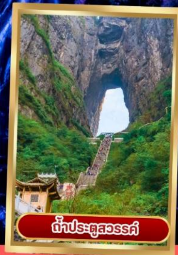
ถ้ำประตูสวรรค์