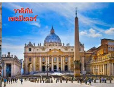
วาติกัน เซนต์ปีเตอร์