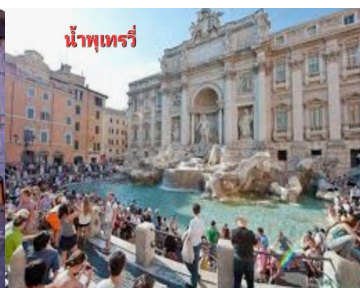
น้ำพุเทร่