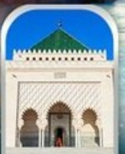
MOHAMMED V SQUARE