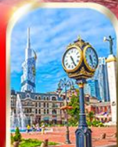
BATUMI CITY ADJARA

เมืองท้ำอุพลิสซิค ■ ป้อมอนาบูรี ■ นั่งกระเช้าชมเมืองบอร์โจนิ อนุสาวรีย์นิตรภาพ รัสเซีย-จอร์เจีย ■ โบสถ์เกอร์เกดี วิหารจวารี ■ มหาวิหารสวตีสคเวลี