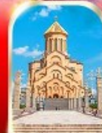
HOLY TRINITY CATHEDRAL