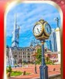
BATUMI CITY ADJARA

เมืองถ้ำอูปลิสซิคะ ■ ป้อมอเนบูรี ■ นั่งกระเช้าชมเมืองบอร์โจมี อนุสาวรีย์มิตรภาพ รัสเซีย-จอร์เจีย ■ โปสต์เทออร์เกดี วิหารจวารี ■ มหาวิหารสาดิสสโควซี