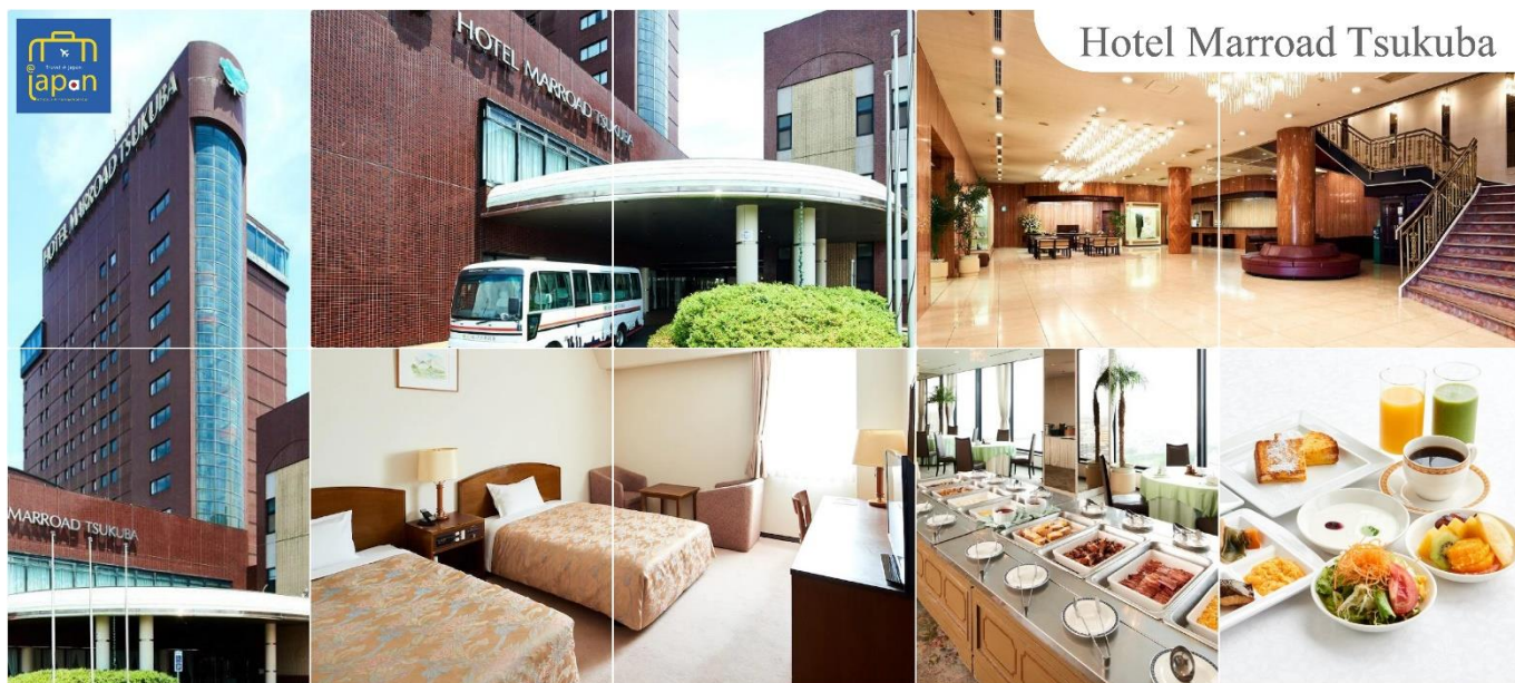
Hotel Marroad Tsukuba

ได้เวลาอันสมควรนำท่านเดินทางสู่ เมืองสีคบุะ (Tsukuba) (ใช้เวลาเดินทางประมาณ 1 ชั่วโมง) รับประทานอาหารเย็น ณ ภัตตาคาร (1) HOTEL MARROAD, TSUKUBA หรือระดับเดียวกัน