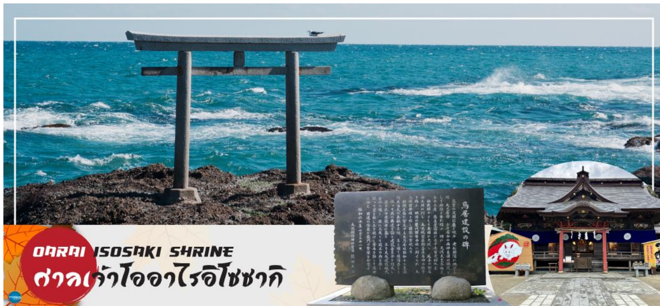
OARAI ISOSAKI SHRINE ศาลเจ้าโอาอิไซซากิ

พระอาทิตย์ขึ้นที่มีชื่อเสียง มีนักท่องเที่ยวมากมายมาเฝ้าคอยเพื่อเก็บภาพช่วงเวลาที่แสงตะวันสาดส่องขึ้นสู่ขอบฟ้า