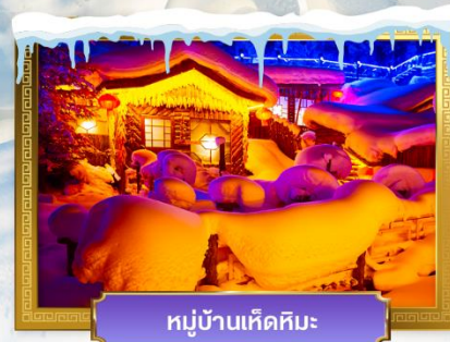
หมู่บ้านเห็ดหิมะ

เดินทางโดย : สายการบินโซน่าเซาเทิร์นแอร์ไลน์