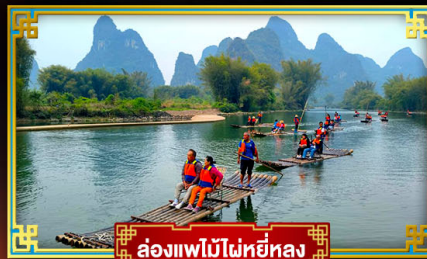
ล่องแพไม้ไผ่หยี่หลง