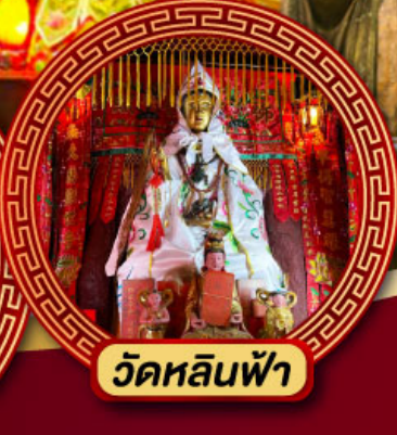
วัดหลินฟ้า