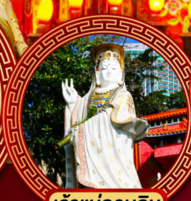
เจ้าแม่กวนอิม รีพัลส์เบย์