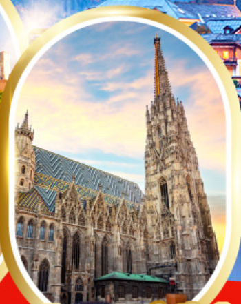
มหาวิหารเซนต์สตีเฟน