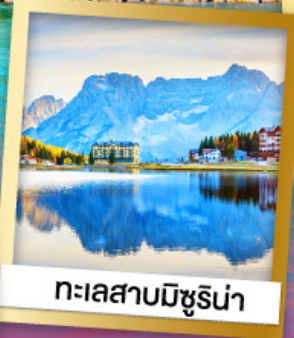
ทะเลสาบมิซูรีน่า