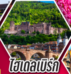
ไฮเดิลเบิร์ก