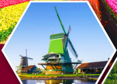
หมู่บ้านกังหันลม ซานส์คินส์