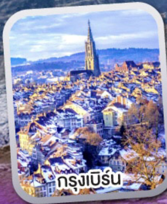
กรุงเบิร์น