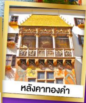
หลังคาทองคำ