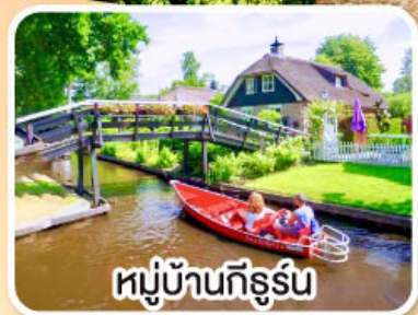
หมู่บ้านกังธูร์น