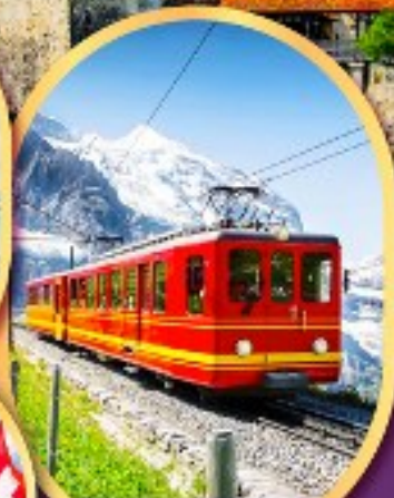
รถไฟสู่ ยอดเขาจุงเฟรา