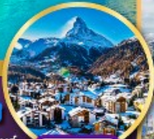
เซอร์แมท