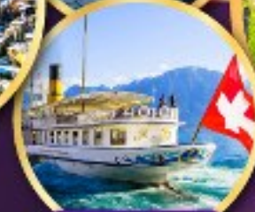
ส่องเรือ ทะเลสาบเจนีวา