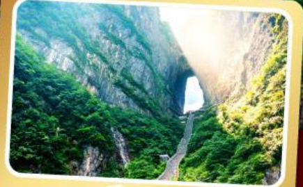
เขาเทียนเหมินซาน

ทริปเดียวเที่ยว 2 เมืองโบราณ ฝูหรงและเฟิ่งหวง