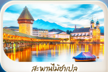
สะพานไม้ชาเปิล