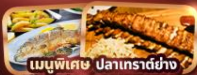
เมนูพิเศษ ปลาเทราต์ย่าง Ribs Of Vienna (1 rack 500g)