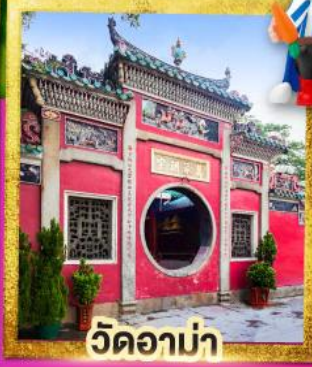
วัดอาบ่า