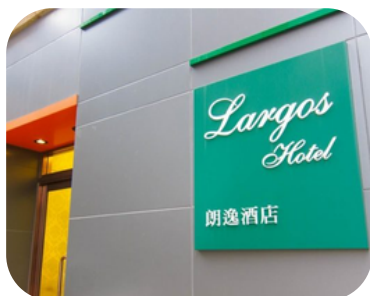
Lagos Hotel (จอร์แดน)