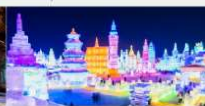
เทศกาลคอมไฟน้ำแข็ง

*ทางบริษัทฯ ขอสงวนสิทธิ์ในการสลับโปรแกรมทัวร์ตามความเหมาะสมขึ้นอยู่กับสถานการณ์หน้างาน โดยคำนึงถึงผลประโยชน์ของลูกค้าเป็นสำคัญ