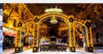
ถนนคนเดินจงหยาง