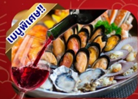
ซีฟู้ด-โฮตัง