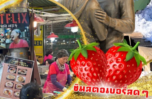
ตลาดกวางจง