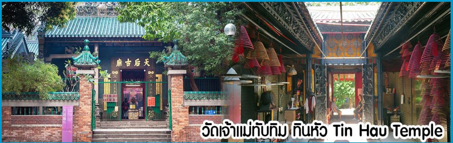
วัดเจ้าแม่ทับทิม ทินหิว Tin Hau Temple

นำท่านไปไหว้ เจ้าแม่กวนอิมฮงฮำ (Kun Im Temple Hung Hom) เป็นวัดเจ้าแม่กวนอิมที่มีชื่อเสียงแห่งหนึ่งในฮ่องกง ขอพรเจ้าแม่กวนอิมพระโพธิสัตว์แห่งความเมตตา ช่วยคุ้มครองและปกป้องรักษาวัดเจ้าแม่กวนอิมที่ Hung Hom หรือ “Hung Hom Kwun Yum Temple” เป็นวัดเก่าแก่ของฮ่องกงสร้างตั้งแต่ปี ค.ศ. 1873 ถึงแม้จะเป็นวัดขนาดเล็กที่ไม่ได้สวยงามมากมาย แต่เป็นวัดเจ้าแม่กวนอิมที่ชาวฮ่องกงนับถือมาก แทบทุกวันจะมีคนมาบูชาขอพรกันแน่นวัด ถ้าใครที่ชอบเสี่ยงเซียมซีเซาบอก ว่าที่นี่แม่นมากที่สุดที่พิเศษกว่านั้น นอกจากสักการะขอพรแล้วยังมีพิธีขอของอั้งเปาจากเจ้าแม่กวนอิมอีกด้วย ซึ่งคนส่วนใหญ่จะ นิยมไปในเทศกาลตรุษจีนเพราะเป็นศิริมงคลในเทศกาลปีใหม่ ซึ่งทางวัดจะจำหน่ายอุปกรณ์สำหรับเซียมซีเซาบอกของแดงไว้ให้ ผู้มาขอพร เมื่อสักการะขอพรโชคลากแล้วก็ให้นำของแดงมาวนเหนือกระถางรูปหน้าองค์เจ้าแม่กวนอิมตามเข็มนาฬิกา 3 รอบ และเก็บของแดงนั้นไว้ซึ่งภายในซองจะมีจำนวนเงินที่ทางวัดจะเซียมซีไว้มากน้อยแล้วแต่โชด ถ้าหากเราประสบความสำเร็จเมื่อมี โอกาสไปฮ่องกงอีกก็ค่อยกลับไปทำบุญ ช่วงเทศกาลตรุษจีนจะมีชาวฮ่องกงและนักท่องเที่ยวไปสักการะขอพรกันมากขนาด ต้องต่อแถวยาวมาก คนที่ไม่มีเวลาก็สามารถใช้เวลาอื่น ๆ ตลอดทั้งปี เพื่อขอของแดงจากเจ้าแม่กวนอิมได้เช่นกัน โดยซื้อ อุปกรณ์เซียมซีเซาบอกจากทางวัดเพียงแต่เตรียมของแดงไปเอง (ในกรณีกับทางวัดไม่ได้เตรียมของแดงไว้ให้เนื่องจากไม่ได้อยู่ใน หน้าเทศกาล) แล้วก็ใส่ธนบัตรตามฐานะและศรัทธา เซียมจำนวนเงินที่ต้องการลงไปด้วย ใส่สกุลเงินยิ่งดีใหญ่ แล้วก็ไหว้ด้วย พิธีเดียวกัน ถ้าประสบความสำเร็จตามที่มุ่งหวังค่อยกลับมาทำบุญที่นี่ในโอกาสหน้า