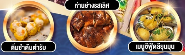
ต้มซ่าต้นตำรับ