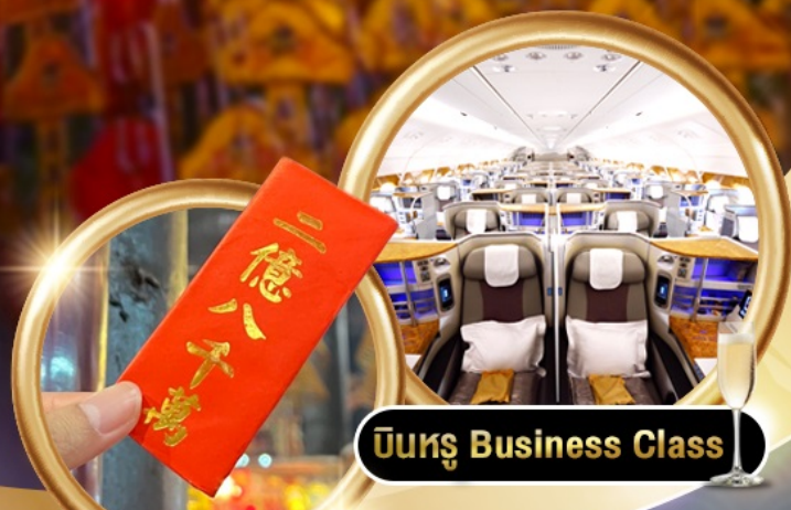
บินหรู Business Class