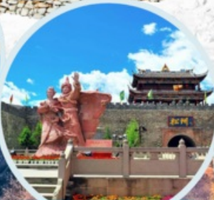
เมืองโบราณซงพาน