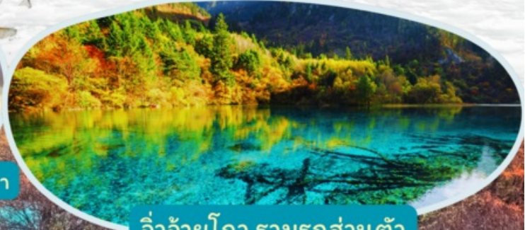
จิวจ้ายโกว รวมรถส่วนตัว