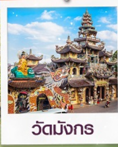
วัดมังกร