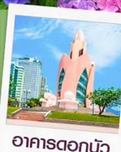
อาคารตอกบัว