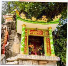
ศาลเจ้าติงซาอู