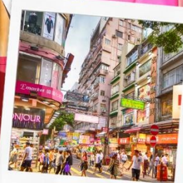
ช้อปปิ้งย่านมงก๊ก