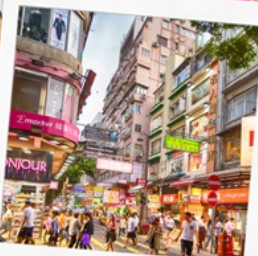
ช้อปปิ้งย่านมงก๊ก