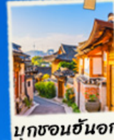
มุกซอนฮันอก