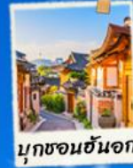
มุกซอนฮันอก