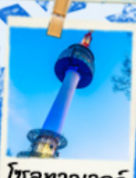
โซลทาวเวอร์