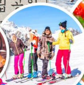
เล่นสกีจุใจ