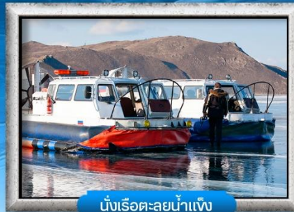
นั่งเรือตะลุยน้ำแข็ง