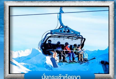
นั่งกระเช้าห้อยขา